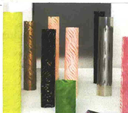
A SINISTRA, BLU CONCENTRICO . SOPRA, I ROTOLI . A DESTRA, LA TENDA . SONO TRE DELLE OPERE ESPOSTE NELLA PRIMA GRANDE ANTOLOGICA DEDICATA ALL'ARTISTA SICILIANA CARLA ACCARDI